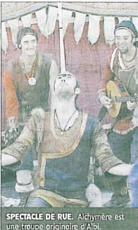
SPECTACLE DE RUE. Alchymère est une troupe originaire d'Albi.