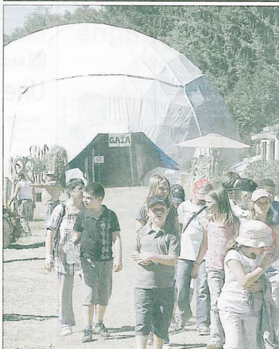
SCOLAIRES. Les enfants ont visité le site en intégralité ce vendredi.