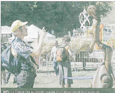
ART. La finesse des sculptures taillées à la tronçonneuse impressionne.