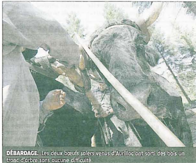
DÉBARDAGE. Les deux bœufs salers venus d'Aurillac ont sorti des bois un tronc d'arbre sans aucune difficulté.