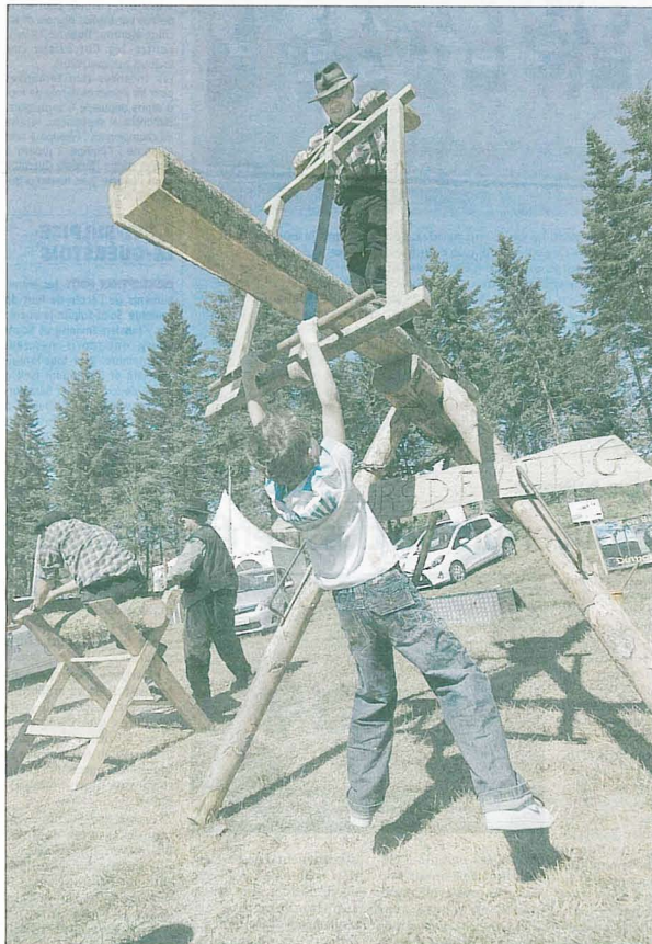
DÉCOLLAGE. Devant la force du scieur, ce petit ne peut que décoller du sol !